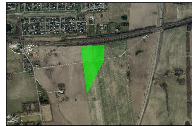
Fremtidigt reserveareal for byudvikling

Miljøscreeningen vurderer konsekvenserne af at udlægge området nord for jernbanen til åben, lav boliganvendelse og området syd for jernbanen til reserveområde for fremtidig byudvikling af Hedehusene sydøst. De to landejendomme nord for jernbanen har indgået en aftale med Lind & Risør om udstykning til i alt ca. 20 parcelhuse. De to eksisterende boliger forventes bevaret.