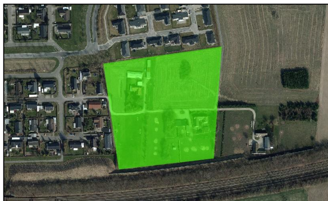
Fremtidigt byområde nord for jernbanen.