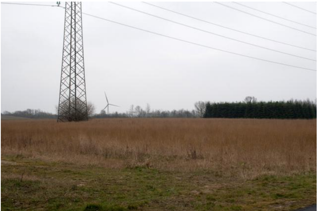
Punkt 1a. Hedehusene øst ved transportkorridoren