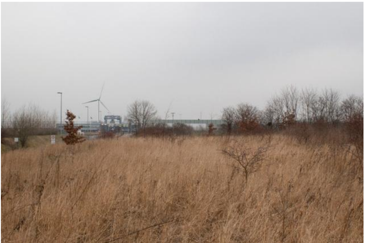
Punkt 3. Skåne Boulevard ved Beringsgade