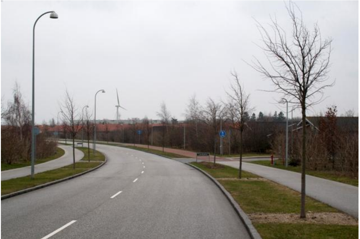
Punkt 2. Frøgård Alle