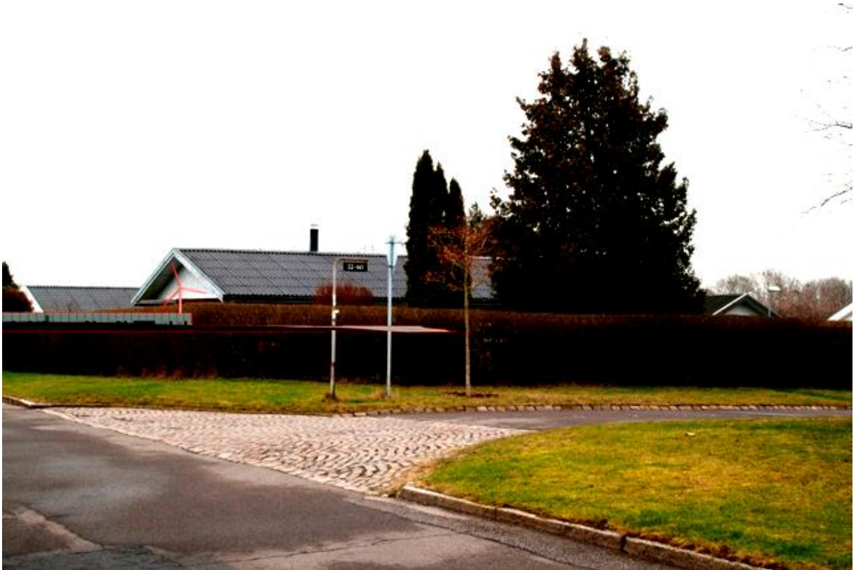
Punkt 1. Hedehusene øst ved Mølleager