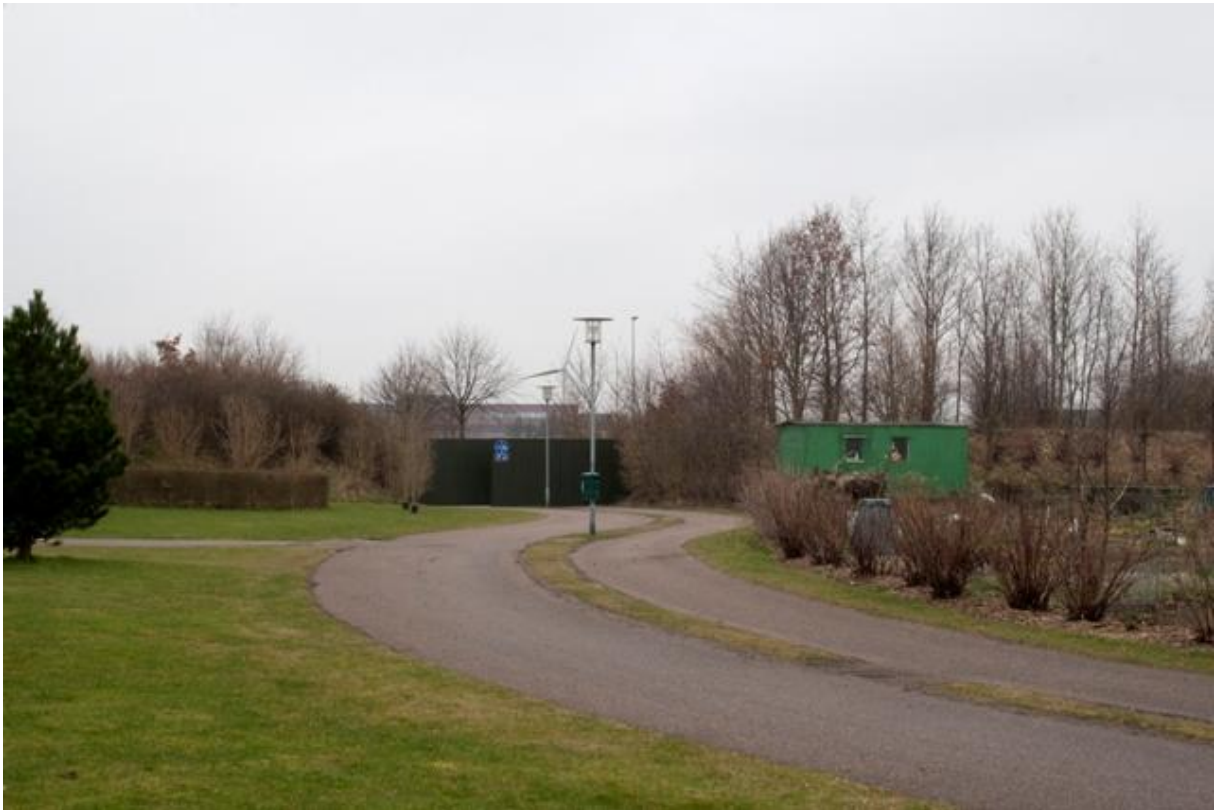
Punkt 4. Torstorp Vest