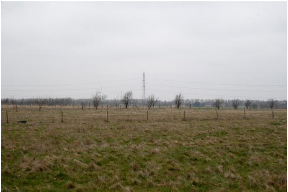
Punkt 5. Mod nord fra Torslundevej